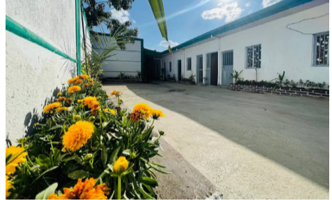
አዲስ አበባ ከተማን በተቆጣጠሩ ቤቶች መካከል።

የገቢዎች ሚኒስቴር፣ የጉምሩክ ኮሚሽን እና ብሔራዊ ሎተሪ አስተዳደር በገቅተኛ የኑሮ ደረጃ ለሚገኙ ዜጎች ያስገባቸውን 102 ቤቶች ታኅሣሥ 27/2014 ዓ.ም. ለጉምሩክ አስረከቡ። በየካ፣ በቁርቆስ እና በባሌ ክፍለ ከተሞች ለአቅመ-ደካሞች የተገነቡትን ቤቶች ያስረከቡት የገቢዎች ሚኒስትር አቶ ላቀ አያሌው እና የአዲስ አበባ ከተማ አስተዳደር ከንቲባ ወ/ሮ አዳኝ አበበ ናቸው። አዲስ አበባ በተካሄደው የርክክብ ሥነ-ሥርዓት ላይ አቶ ላቀ አያሌው እንዲሉት፣ እንዲህ ዓይነት በጎ ተግባራት በቀጣይም እንዲከናወኑ ዜጎች የሚጠበቅባቸውን ቀርጥና ታክስ በወቅቱ መክፈል እና ደረሰኝን በአግባቡ መጠቀም አለባቸው።