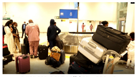
ወደ ሀገር የገቡ ዲያስፖራዎች አየር ሙንገድ ላይ።